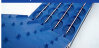
Für Rundspieße von 80 bis 235 mm